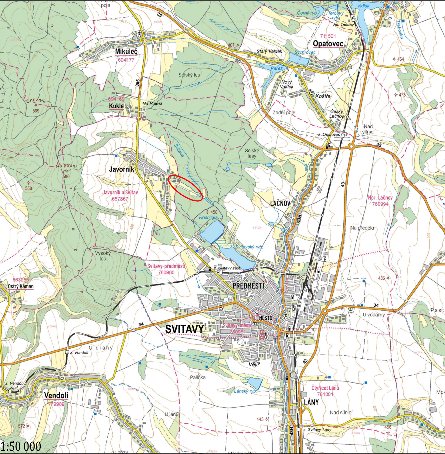
SITUAČNÍ VÝKRES ŠIRŠÍCH VZTAHŮ - Základní mapa